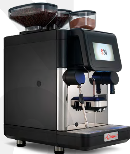
LaCimbali S20 – Front and ¾ front view

Leistungskapazität von bis zu 200 Tassen pro Tag bei gleichbleibender hoher Qualität.