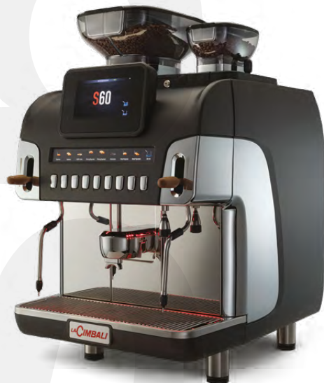
LaCimbali S60 – Front and ¾ front view

Eine intelligente Maschine mit bidirektionaler Telemetrie, Fernsteuerungsoptionen und der Möglichkeit, eine Verbindung zur CUP4YOU-App herzustellen.