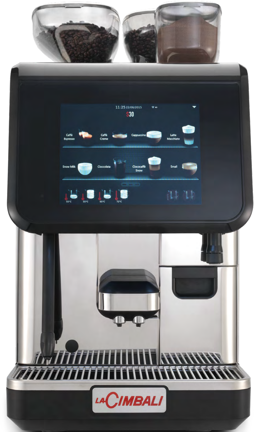
LaCimbali S30 – Front and ¾ front view

Leistungskapazität von bis zu 300 Tassen pro Tag bei gleichbleibender Qualität.