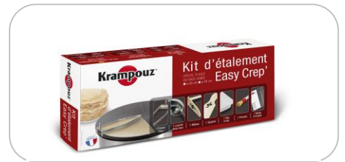
Kit d'étalement / kit spreader