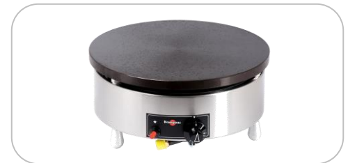
Crêpières gaz / gas crepe makers