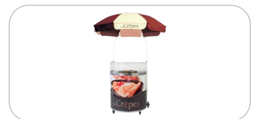
Chariots à crêpes / crepe carts