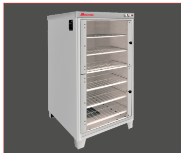
Расстойный шкаф ШРЭ-2.1